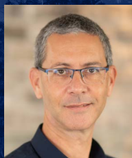
פרופ' אלון קלמנט המנהל האקדמי של תכנית ת"א ברקלי