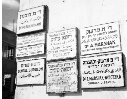
[אוסף צילומים של הצלם זולטן קלוגר | ISA-Collections-ZKlugerPhotos-00132ol]. 1946. אוסף צילומים של הצלם זולטן קלוגר

”מסע הדיג” תזמן שוב את סוף שנות השלושים (אז החלו משתמשים בחומרים איכותיים פחות) כקו גבול עליון לתיארוך השלט. אבל ניתן למצוא מקורות השוואה נוספים לצורך התיארוך. יש לשער שגינצברג פנתה לדמויות במעגלים החברתיים והמקצועיים וביקשה הפניה ליצרן שלטים. אם השלט הוכן לצורכי המשרד הראשון של גינצברג ברחוב תנקרד, תהיה זו השערה יותר מסבירה שפנתה לעו”ד הורוביץ. משרדיהם שכנו באותו בניין, ובו שימשה גם מתמחה של עו”ד הורוביץ. ייתכן שבשם האחידות פנתה לאותו יצרן שלטים. ייתכן ששאלה את הורוביץ מי הכין את שלט משרדו. עם זאת, ה”רפרנס” חסר. כלומר, השלט המקורי אינו בנמצא, והשלט הישן ביותר שברשות המשרד הוכן ככל הנראה בשנים מאוחרות יותר, למשרד בתל אביב.