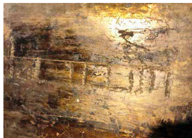
[חלקו האחורי של השלט]